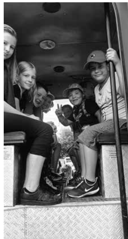
S úctou rodičia detí z 2.B

zbor. A vám, hasiči, ktorí ste pre nás a naše deti venovali v tento deň čas, patrí srdečná vďaka a jedno ďakujem za nás všetkých. Práve vám veľa úspechov, veľa zdolaných prekážok a hlavne veľa zdravia v tak náročnej dobrovoľnej činnosti. Veríme, že nikto z nás vás nebudeme potrebovať. A ak aj áno, dnes viem, že spravíte maximum pre nášho občana, našu obec a všetkých ostatných.