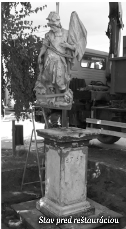
Stav pred reštauráciou

zásahov, tmelov a premaliieb. Tento proces si vyžadoval citlivý prístup, aby nedošlo k poškodeniu deštruovaného kameňa a pôvodnej polychrómie. Následne bol povrch horniny zbavený nežiadúcich zvyškov bioflóry a solí, t.j. odsolený pomocou zábalov z destilovanej vody a fungicídu. Po dôkladnom vysušení kamennej hmoty boli jednotlivé časti pamiatky petrifikované – spevnené konsolidačným prostriedkom, viacnásobným náterom, až po nasýtenie zvetraného materiálu. Po vyprchaní riedidlovej zložky z petrifikačného roztoku bolo možné pristúpiť k rekonštrukcii chýbajúcich detailov, podľa študijných analógií. Čnelka s brmbolcom bola najskôr namodelovaná v hline, až následne