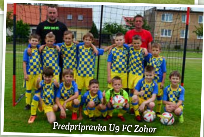
Predprípravka U9 FC Zohor