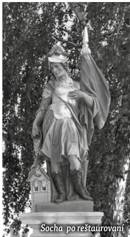
Socha po reštaurovaní

livých častí odevu, brnenia i prilby rímskych legionárov, ale aj barokového mramorovania... Pred samotným čistením bolo nutné pristúpiť k stabilizácii prasklín a lepeniu jednotlivých poškodených častí a polámaných úlomkov. Plastické scelenie, lepenie jednotlivých častí bolo realizované prostredníctvom nehrdzavejúcich antikorových kolíkov. V ďalšom procese prác bola pamiatka celoplošne očistená (chemicky aj mechanicky) od neviazaných i viazaných depozitov, uhľíkových depozitov, bioflóry, rastlinných porastov, nežiadúcich sekundárnych