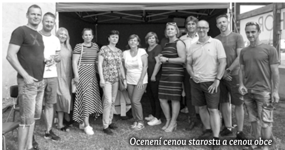
Ocenení cenou starostu a cenou obce

Dominantou je predovšetkým hokejbal, ktorý v našej obci v súčasnosti prilákal značnú časť detí a mládeže. Hrá sa vo viacerých kategóriách od mini prípravky až po seniorov, v lige na Slovensku a v Čechách. Dosahujú veľmi dobré výsledky, hlavne v mládežníckych kategóriách a príkladne reprezentujú našu obec. V súťažiach sa umiestňujú na popredných miestach a mnohí dosiahli individuálne ocenenia.