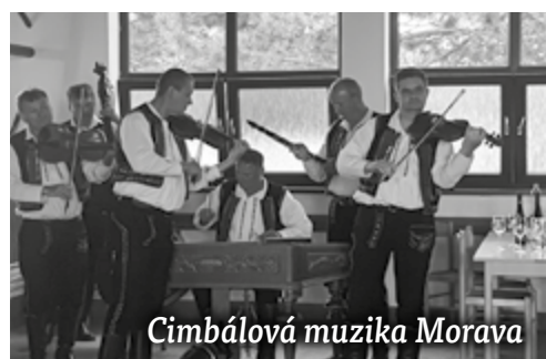
Cimbálová muzika Morava

V sobotu 16. júla po futbalovém zápasu sa na hrišči konau Hodové posedzení .