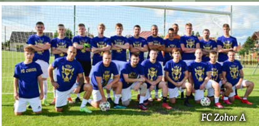
FC Zohor A