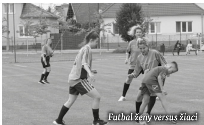
Futbal ženy versus žiaci