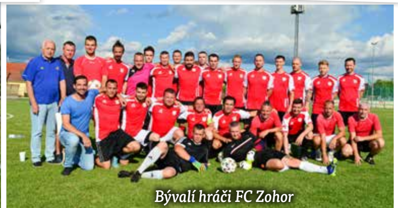
Bývalí hráči FC Zohor