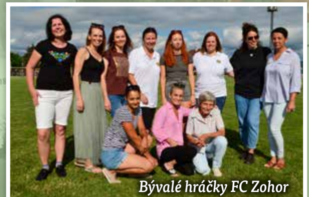
Bývalé hráčky FC Zohor