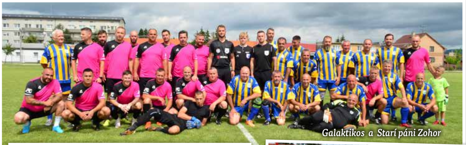
Galaktikos a Starí páni Zohor