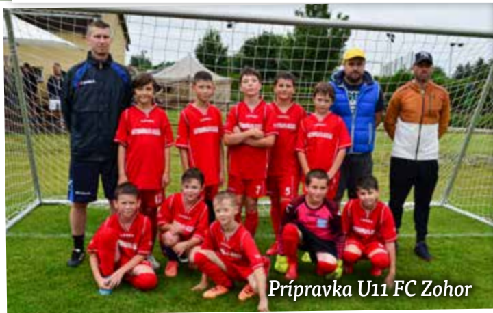
Prípravka U11 FC Zohor