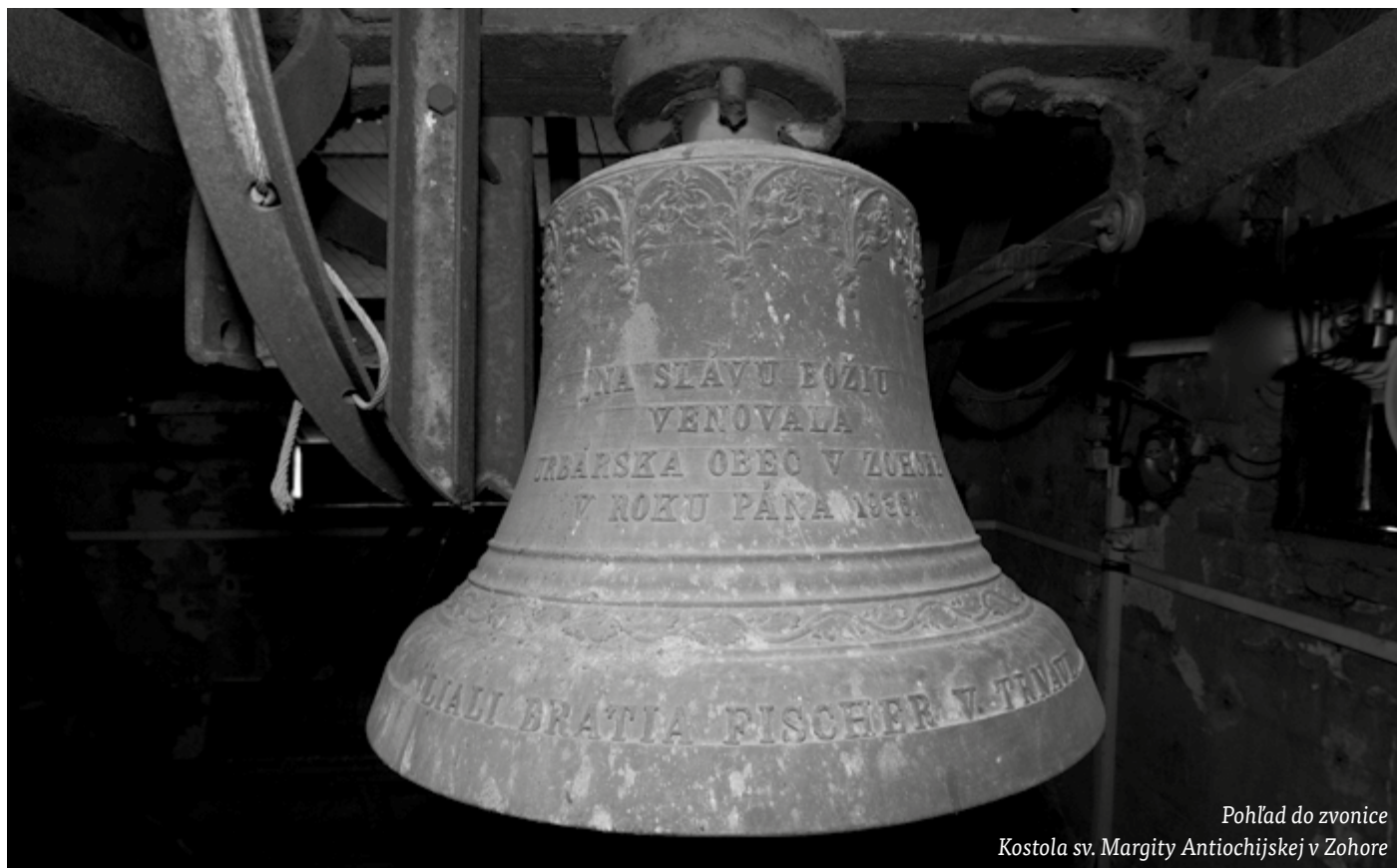
Pohľad do zvonice Kostola sv. Margity Antiochijskej v Zohore