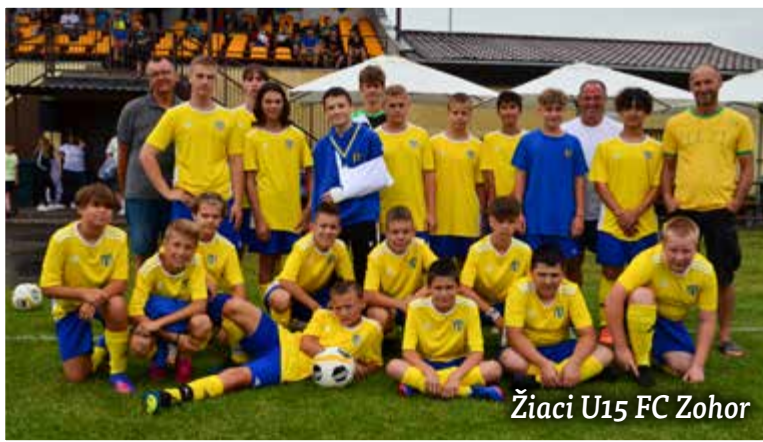
Žiaci U15 FC Zohor