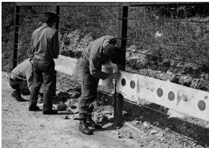
Príprava terčov k súťaži

Strelecký oddiel bol v obci strojom i garantom početne obsadených pretekov Sokolovské (zimné obdobie) a zvlášť Dukelské (na prelome leta a jesene) preteky brannej zdatnosti. V týchto pretekoch dostávali veľkého uplatnenia najmä tí, čo sa okrem behu venovali i strelectvu.