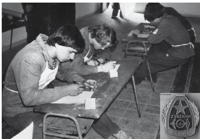
Školenie a výcvik brancov v Zohore

Najdôležitejšou úlohou Zväzarmu bola výchova brancov. Branci boli mladí muži pred nástupom do základnej vojenskej služby.