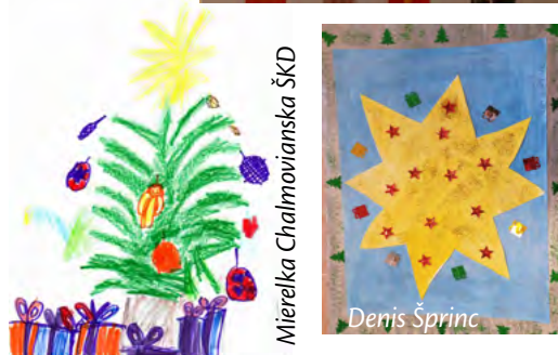
Mierelka Chalmovianska ŠKD