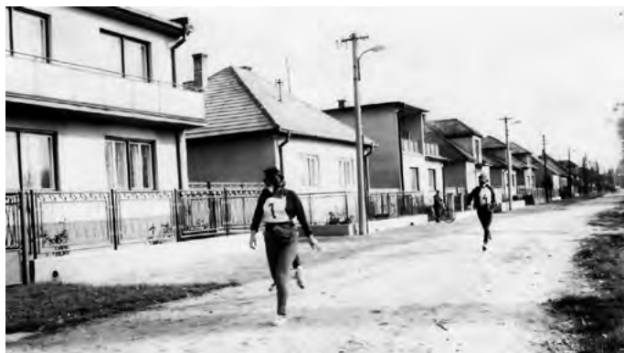
Beh v plynových maskách v uliciach obce