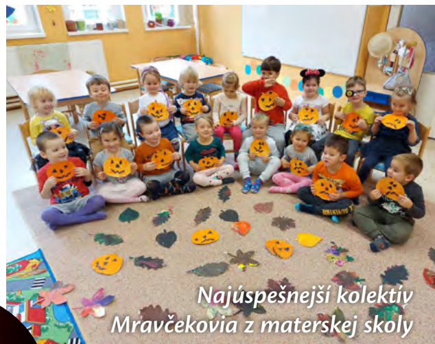
Najúspešnejší kolektív Mravčekovia z materskej školy