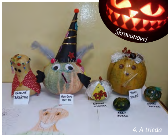
4. A trieda