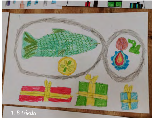
1. B trieda