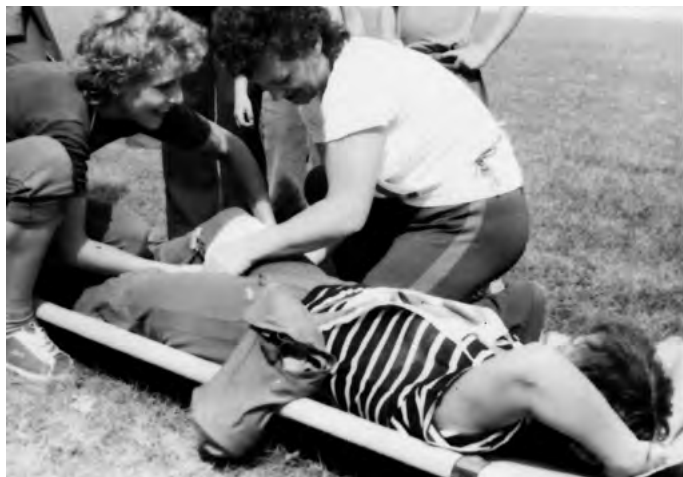
Jednou z úloh činností k hodnoteniu pretekárov počas pretekov „O POHÁR predsedu MNV“ bolo poskytnutie prvej pomoci zranenému športovcovi.