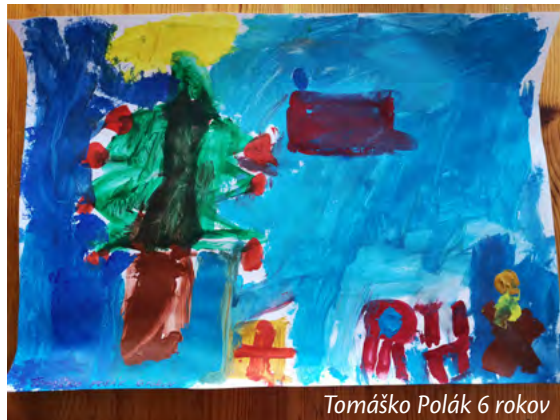
Tomáško Polák 6 rokov