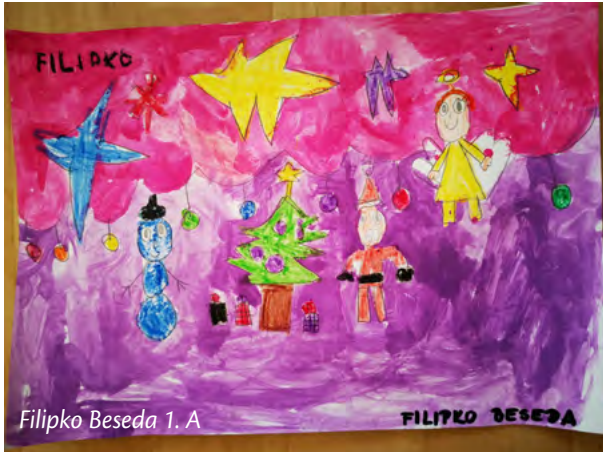
Filipko Beseda 1. A