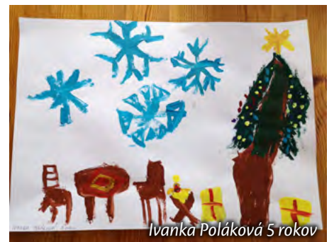
Ivanka Poláková 5 rokov