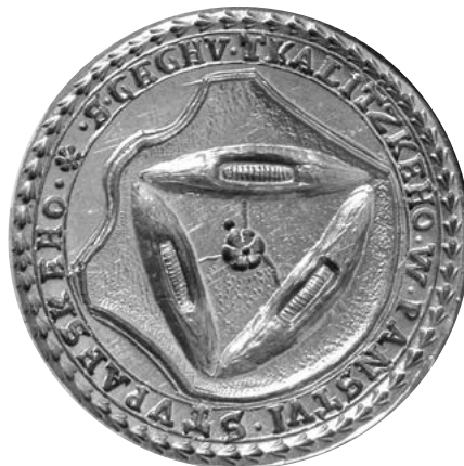
Pečatidlo stupavského cechu tkáčov.