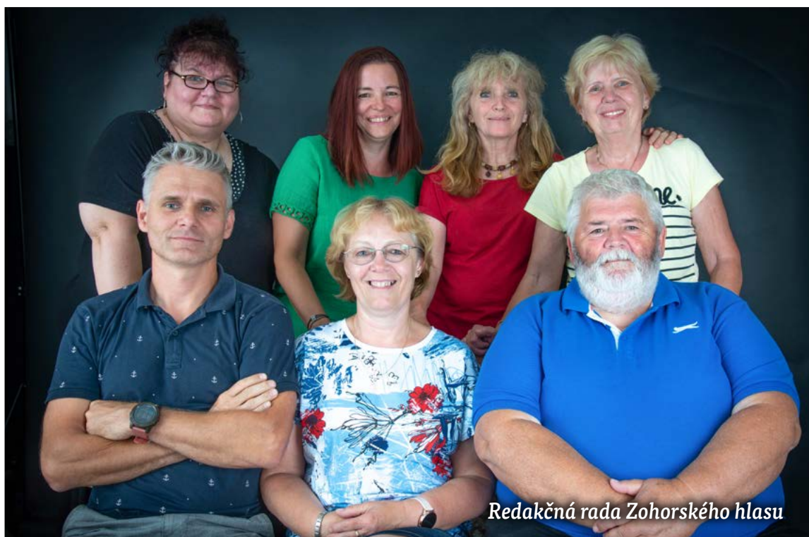
Redakčná rada Zohorského hlasu