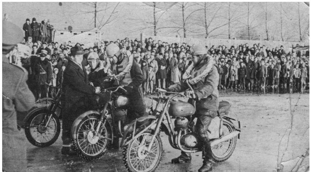
- Plochodrážne preteky na zamrznutej Hlbočine 7. januára 1962. Vzadu je vidieť plot športového štadióna. -

býval v obecnej pastierni, ktorého súčasťou boli maštale pre plemenné býky (bujaky). Obecná pastierňa v Zohore sa nachádzala na mieste terajších bytových domov na rohu ulíc Tichá a Kováčska. Toto miesto sa nazývalo „bujáreň“, bola tu aj studňa pre napájanie dobytky. Náplňou obecného pastiera bola starostlivosť o všetok dobytok v obci, ktorý mala takmer každá rodina. Obecný pastier sa v prvom rade staral o zdravú reprodukciu kráv, o čom viedol záznamy. Taktiež pomáhal pri telení kráv a na požiadanie pomáhal s liečením chorých zvierat. Okrem tejto činnosti zabezpečoval so svojimi pomocníkmi pasenie dobytky na obecných pasienkoch. Keďže krava vypije za deň priemerne až 75 litrov vody, pasienky sa museli nachádzať v blízkosti napájadiel. V Zohore bol takým miestom rybník s názvom „Hlbočina“, zásobovaný potokom pritekajúcim z Malých Karpát. Hlbočina sa rozprestierala medzi dnešnými ulicami Požiarnická, Kováčska, Lábska a Na pasienkoch. V pozemkovej