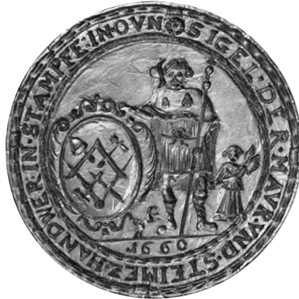
- Pečatidlo stupavského cechu murárov a kamenárov z roku 1660. Zo zbierok Múzea mesta Bratislavy -

sakrálnych objektov. Až výstavbou hradov a mostov vznikla požiadavka zakladať svetské stavitelské školy nazývané hute . Ako zaujímavosť je vhodné spomenúť pôvod slova „ palier “ (majster na stavbe). Vzniklo z latinského „ parlerius “ (hovorca), francúzsky „ parler “ znamená hovoriť. V stavebnej huti bol palier organizátorom stavebných prác. Jeden