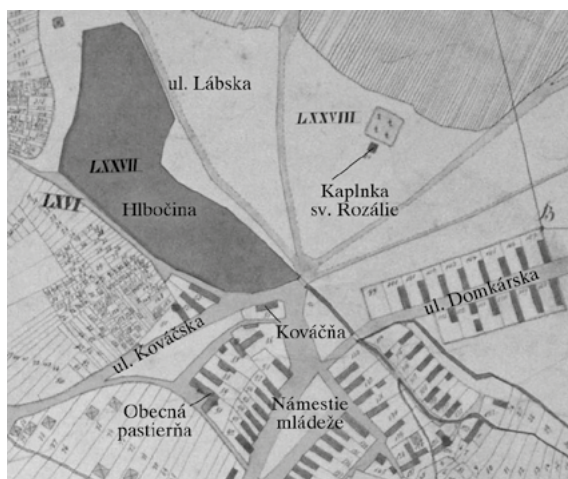
- Katastrálna mapa Zohora z roku 1854 -

pôžičku. Všetky výdaje cechu plynuli z povinných príspevkov do cechovej truhlice. V cechových artikulách bol určený pracovný čas, výška odmien pracovníkov, pracovná norma i tresty pre previnilcov. Bolo stanovené dodržiavanie ďalšieho času na odpočinok (okrem nedelí a sviatkov), povinné kúpele tovarišov, povinná vandrovka tovarišov (minimálne 3 roky) a ich mzdy. Členom cechu artikuly zakazovali podomový predaj, svoje výrobky smeli predávať len na trhu. Továriši mali povolené vlastné, tzv. „modré pondelky“, ktoré slúžili na ich rozptýlenie. Cechové artikuly boli aj akýmsi zákonom, v ktorom boli obsiahnuté aj tresty pre previnilcov a ustanovenia, na základe ktorých mohol byť majster vyhlásený za nepoctivého. Zakazovali napríklad nadmerné pitie, bitky a hádky. Chlapci boli prijímaní do učenia od veku trinásť rokov. Museli spĺňať kritérium manželského pôvodu a ich rodičia nesmeli byť nevoľníci, pretože cechovní remeselníci boli slobodní. Učebná doba trvala 3-4 roky, podľa druhu remesla. Počas nej učeň býval u majstra a dostával od neho stravu, ošatenie a obuv. Skúšobná doba pred prijatím do učenia trvala 2-6 týždňov, potom rodina učňa zaplatila poplatok za výučbu a učeň v nej pokračoval. K jeho povinnostiam patrila okrem iného aj pomoc majstrovej žene v domácnosti. Majster dohliadal na učňovu výchovu a bol za neho zodpovedný. Učeň dostal po vyučení