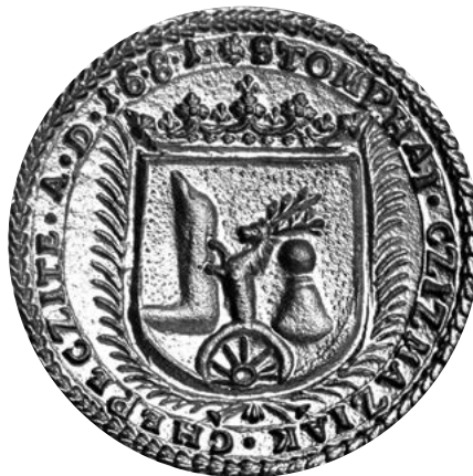
- Pečatidlo stupavského cechu čižmárov z roku 1681. Zo zbierok Múzea mesta Bratislavy -