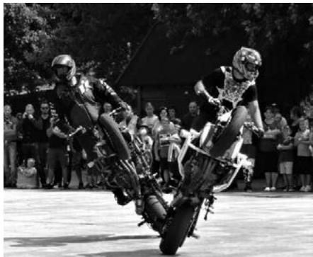
Jazda na špeciálnych motorkách „stuntrider“

Ľudia sa tešia najmä na vystúpenie stun- triderov.