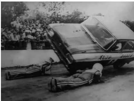
Kaskadérske umenie v Zohore z 80-tych rokov

Hluk áut a motoriek, ktorý otriasal blíz- kymi budovami, kúdol dymu, vôňa benzínu a spáleného oleja bol magnetom pre fanúšikov vzhladnúť viac ako hodinové vysoko adrena- linové predstavenie pre všetky vekové kategó- rie. Lákadlo, ktoré si len tak nemohol nechať ujasť takmer žiadny občan Zohora.