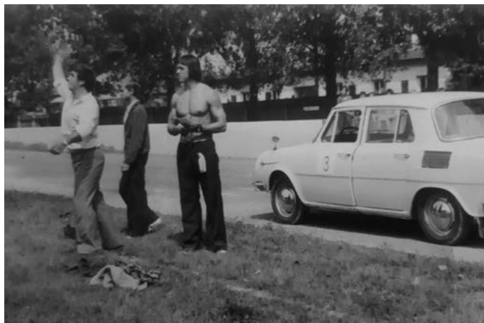
– Hod granátom a kriketovou loptičkou na cieľ –

Okrem toho, že pod hlavičkou Zväzarmu pracovali oddiely ako napr. Automotoklub Zohor (AMK) – plochá dráha, strelectvo, HIFI klub, Bikros, podieľali sa aj na organizovaní