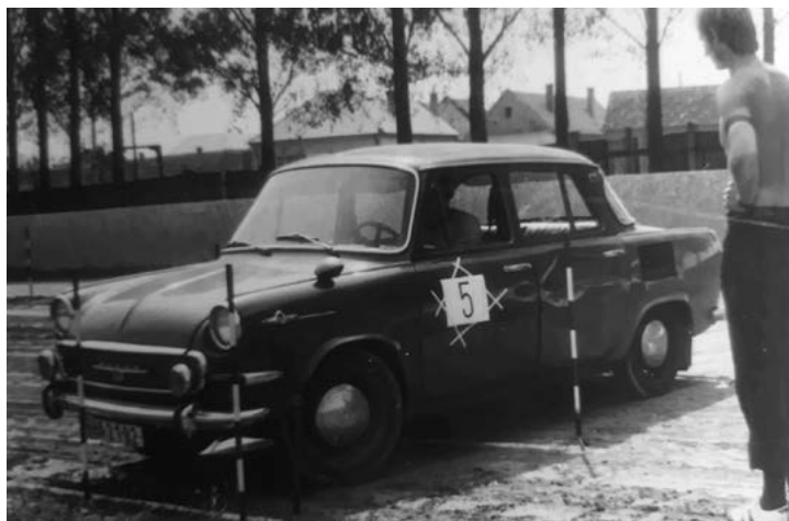
– Jazda zručnosti rok 1974–1975 –

Z dostupných archívnych materiálov zaznamenal Kamil Somorovský