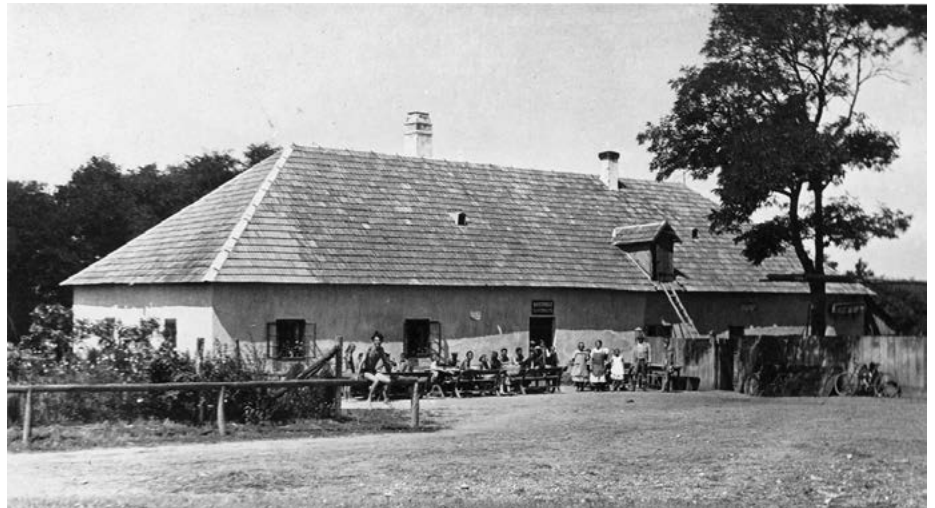
– Hostinec na Temrajze –

Kúsok od hostinca smerom na západ je na mape na rieke Morave označené „Überfuhr“ (kompa). Hostinec na Temrajze stál na vyvýšenom mieste a pod ním sa stretali cesty z okolitých dedín: zo Zohoru cez Piesky, z Devína, Stupavy, Mástu, Vysokej pri Morave a dokonca tu bola v prevádzke aj kompa do Rakúska s cestou do Viedne. Podľa tejto mapy sa nachádzali na slovensko-rakúskom úseku Moravy ešte ďalšie štyri kompy. Prvá prepravovala pri soche orlice nad rakúskou obcou Marchegg, druhá spájala obce Záhorskú Ves a Angern, tretia zabezpečovala prepravu pri Gajaroch a štvrtá pri Veľkých Levároch.