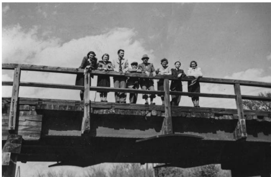
– Zohorskí učitelia na drevenom moste nad železničnou traťou pri Vačkovej –