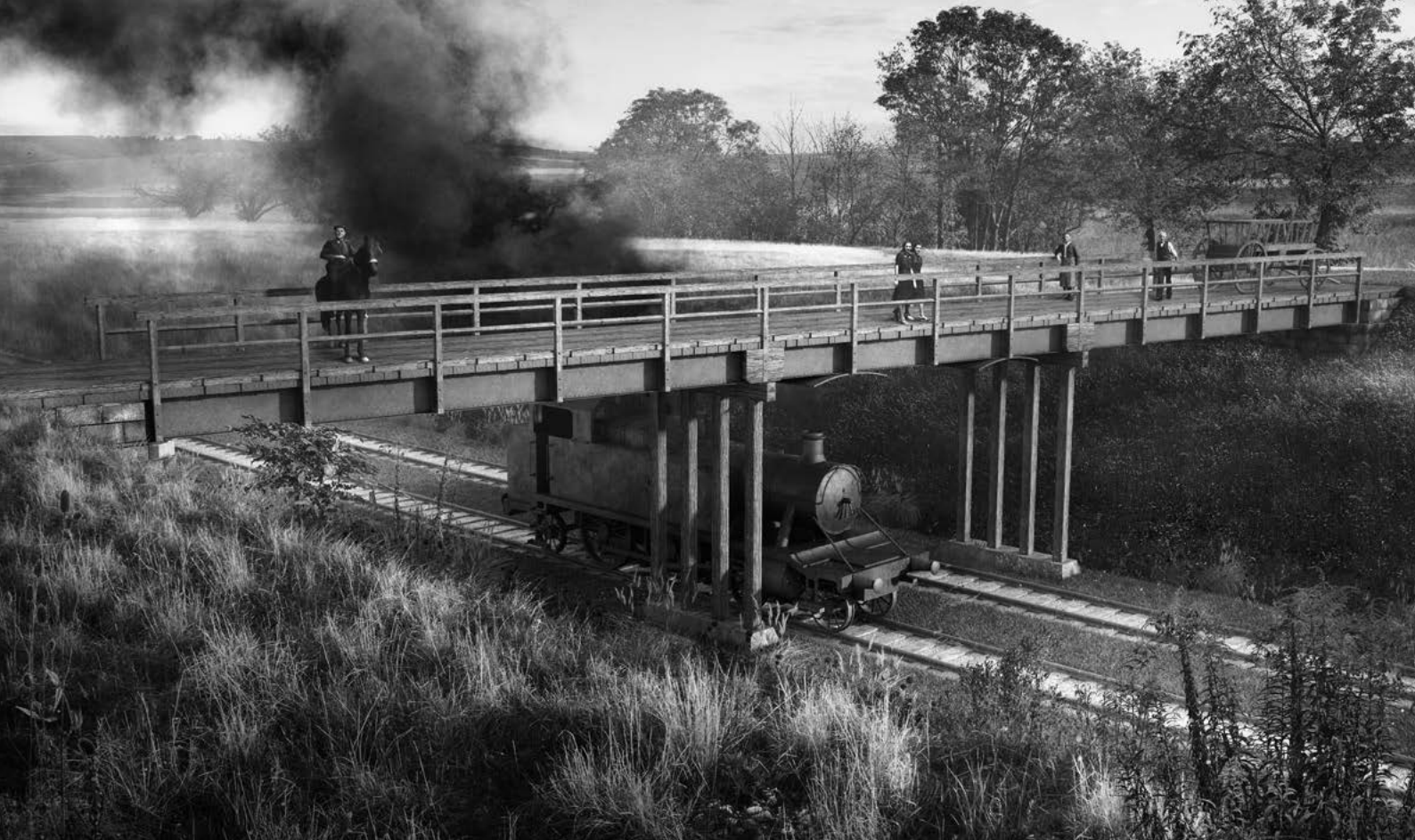
– Vizualizácia dreveného mosta. Autor Ing.arch Peter Buffa –