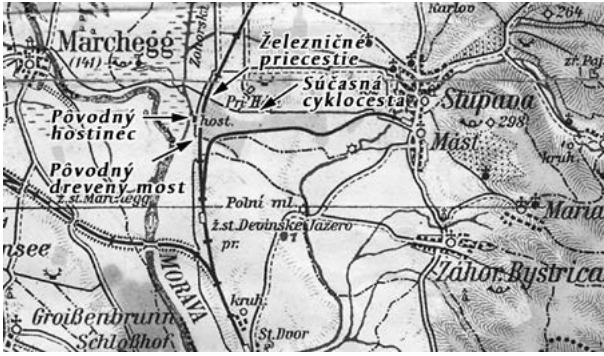
– Mapa z polovice 20. storočia –

bol nad železnicou vybudovaný most. Krajné podpory mosta boli murované z kamenných kvádrov a dve vnútorné podpory tvorili štvorice štíhlych drevených stĺpov. Mostné nosníky boli z ocele, mostovka a zábradlie z dreva (viď vizualizáciu). Most bol však v rámci rozsiahleho zabezpečovania štátnej hranice v 50-tych rokoch 20-teho storočia odstránený. Doteraz o ňom svedčí iba zachovaná kamenná podpora zo strany rieky Moravy.