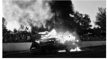
Horiaci automobil na zohorskej plochej dráhe

V súvislosti so zaujímavou a pútavou KASKADÉRSKOU SHOW, resp. AUTORÓDE- OM v Zohore 26. júna 1988 nám nedá nepripo- menúť (oživiť) našim občanom, že táto atrak- cia sa konala aj za účasti hudobnej skupiny ELÁN na čele s populárnym spevákom Jožom Rážom. Skupina ELÁN práve v tomto roku slá- vila 20. výročie existencie, a bola pre organi- zované podujatie veľkým magnetom! V tých časoch patrila skupina medzi najpopulárnej- šie kapely na Slovensku. Počas akcie natočila klip k piesni NEBEZPEČNÝ NÁKLAD. Pesnička