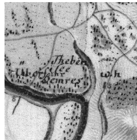
Mapa z prvého vojenského mapovania 1763–1785

stanica sa nachádzali len štrnásť kilometrov od rímskej hranice a plnili významnú úlohu v diaľkovom obchode ako colné kontrolné body.“ Vo svojej prednáške, „Jantárová cesta a Záhorie. Germánske elity vo svetle rímskych stavieb, kniežacích hrobov a rímskeho importu v Bratislave-Dúbravke a Zohore“, ktorú predniesol 20.septembra 2018 na konferencii v Bratislave-Rusovciach, podčiarkuje historický význam germánskeho sídliska centrálneho charakteru v Zohore. Citát z prednášky sa týka významného nálezu kniežacích hrobov: „Kniežacie hroby zo Zohora možno datovať približne od prelomu prvého a druhého storočia po druhú tretinu druhého storočia. V tom čase vznikol areál s rímskymi stavbami v Stupave. Je pravdepodobné, že germánska elita zo Zohora si tieto stavby nechala vybudovať rímskymi stavitelmi a okolo polovice druhého storočia sa tu usadila. Medzi vzácne nálezy zo Zohora patria aj rímsky zlatý pečatný prsteň s gemou, na ktorej je zobrazený orol légii medzi štandardami rímskeho vojska, dva zlaté príviesky z germánskych žiarových hrobov a úlomky držiadiel rímskych kanvic s plastickou výzdobou. Predpokladá sa, že germánska nobilita, ktorá bola postupne romanizovaná, si v bezprostrednej blízkosti rímskej hranice nechala vybudovať ďalšie rezidencie s rímskymi stavbami, ktoré sa nachádzali v Bratislave-Devíne a v Bratislave-Dúbravke v treťom storočí po Kristovi.“