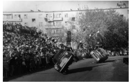
Kaskadérska dráma pre divákov ...

sa stala nielen Top piesňou, ale aj najdlhšou čo sa týka minútáže (4,27 min) na ich šiestom al- bume, ktorý vyšiel 1. 10. 1988 (pred 33. rokmi).