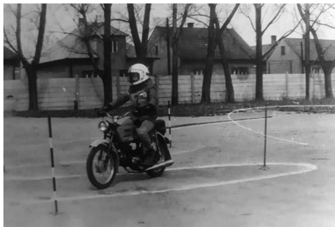
– Jazda na motocykli zn. "Mustang" slalom –

akcelerácie. Vhodne vytýčená trať respektíve okruh, ktorý meral cca 700 m mal veľa zákrut, bol pomerne rýchly, náročný na techniku jazdy, kvalitu a odolnosť. Súťažiacich preverilo niekedy aj nepriaznivé počasie. Šmykľavý terén kládol zvýšené nároky na dokonalú zručnosť v jazde. Veľakrát klzký povrch zohral svoje čaro. Tu musel účastník dokázať, že ho od úspechu dostať sa do cieľa nič tak ľahko neodradilo.