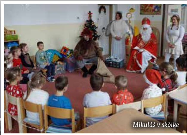
Mikuláš v škôlke