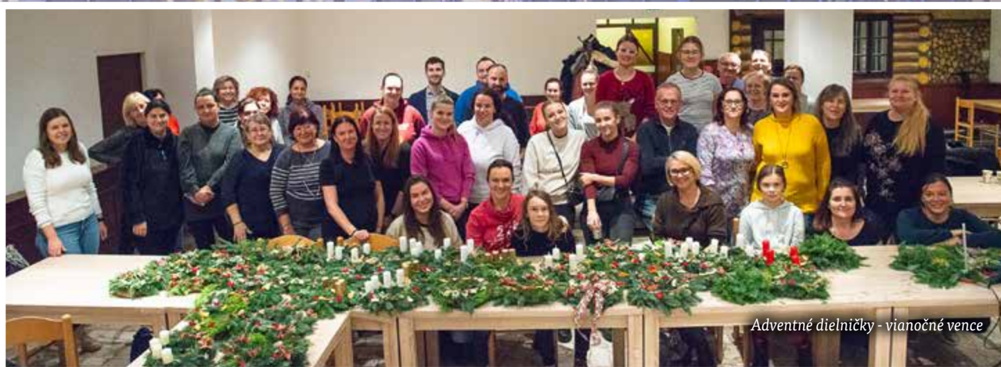
Adventné dielničky - vianočné vence