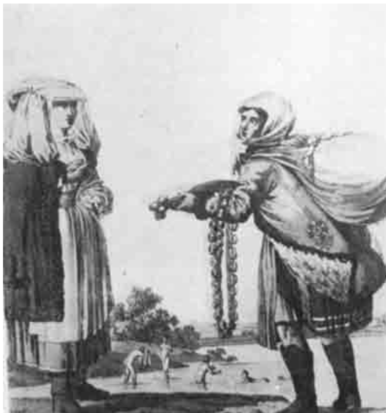
Cibuliarka zo Zohora a žena z okolia Eisenstadtu, rytina podľa J. H. Bikkessiho 1816