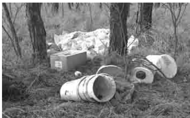
... už je aj vymalované