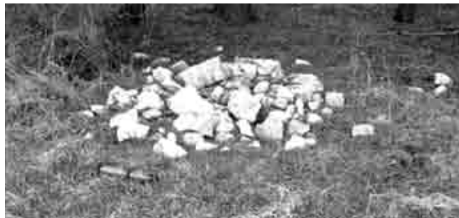
... priečky sú vybúrané