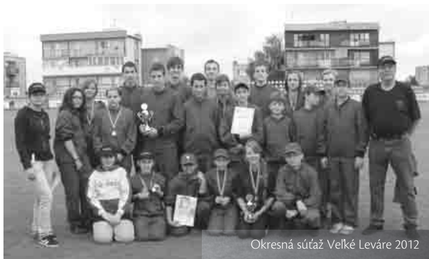
Okresná súťaž Veľké Leváre 2012