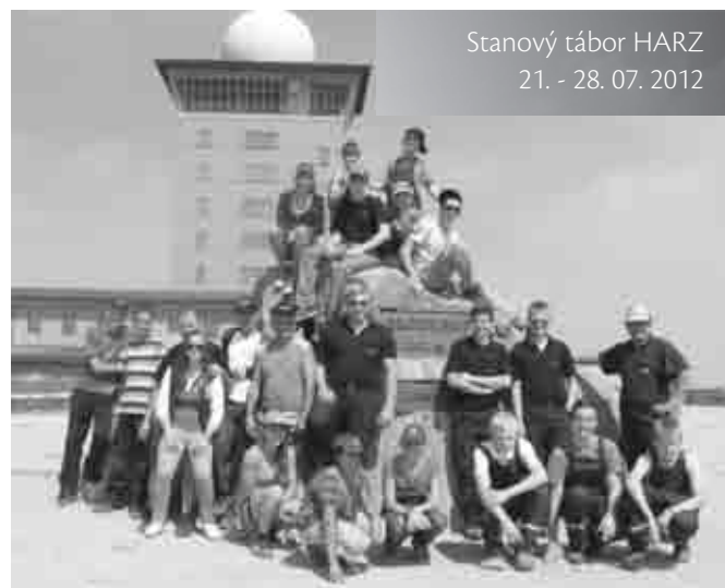
Stanový tábor HARZ 21. - 28. 07. 2012