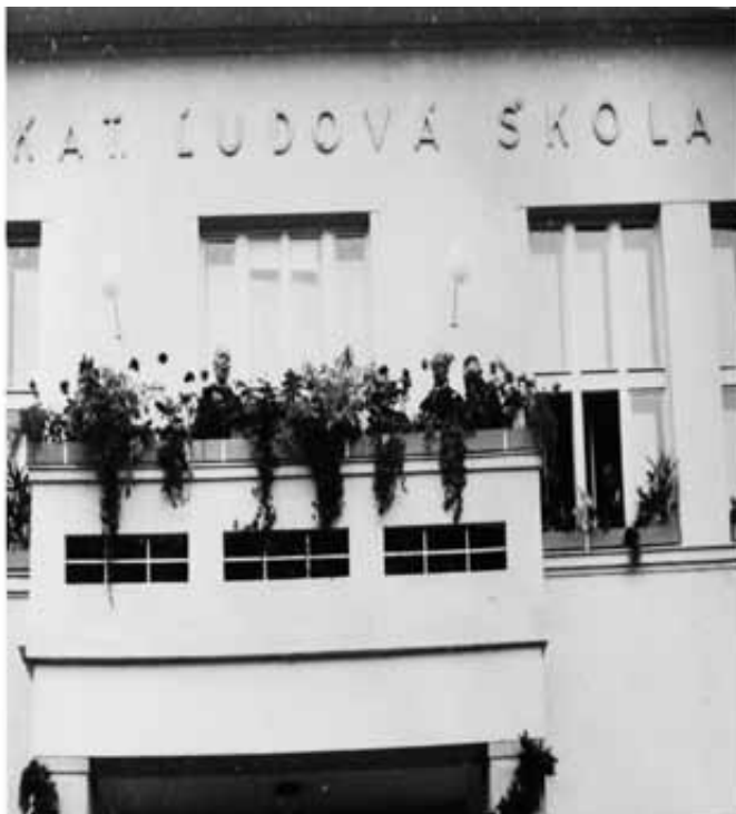
Na fotografii sa nachádza Andrej Hlinka na balkóne dnešného Obecného úradu.

Blíži sa dátum 16. august. Pre mnohých ľudí obyčajný všedný deň, možno pracovný, možno rekreačný. No 16. august nie je obyčajný deň. V tento deň si pripomíname pamiatku veľkej osobnosti slovenskej histórie. Osobnosti, ktorá „bojovala“ za slovenský život, jazyk, autonómiu. Osobnosť, akou bol otec národa Andrej Hlinka. Mnohí z vás určite vedia, že na priečelí budovy obecného úradu sa nachádza pamätná tabuľa Andreja Hlinku. Miestny odbor Matice slovenskej Devínska Nová Ves spolu s Obecným úradom Zohor vás pozývajú na pietnu spomienku, ktorá sa uskutoční pri pamätnej tabuli Andreja Hlinku dňa 13. 8. 2011 o 10:00 hodine. Príďte spolu s nami vzdať úctu tomuto veľikánovi.