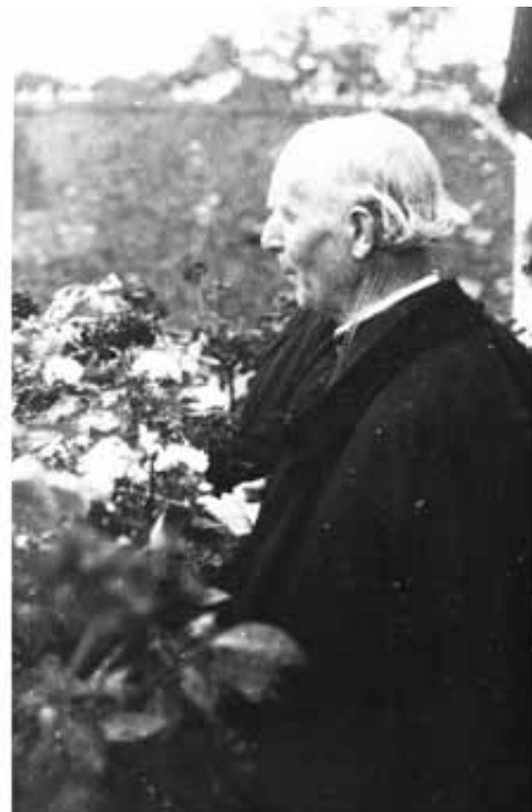
Andrej Hlinka na balkóne dnešného OÚ Zohor.