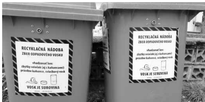
Kontajner na sviečky

Cieľom zberu odpadových sviečok nie je len recyklácia vosku, ale recyklácia čo najväčšieho objemu odpadu, ktorý tak nemusí skončiť na skládke. Samozrejme prihliadnuc aj na iné okolnosti a najmä ekonomickú udržateľnosť takejto recyklácie. Čo všetko do nádob na odpadové sviečky patrí a čo nie?