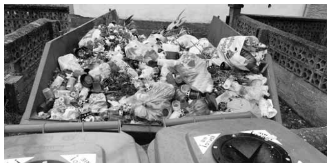
Sviečky na nesprávnom mieste