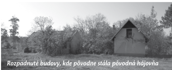
Rozpadnuté budovy, kde pôvodne stála pôvodná hájovňa

Spoločenstvo prvou kúpnu zmluvou kúpilo les v spomínanej výmere 335 k.j. za cenu 1 005 000 Kčs. (192 ha 78 a). Na začiatku roku 1945 druhou kúpnu zmluvou gróf predal Spoločenstvu hájovňu s príslušenstvom a ďalší les vo výmere 86 k.j. 304 š.s. (49 ha 59 a) za cenu 585 880 Kčs. Spoločenstvo riadne užívalo spoločný les vo výmere 234 ha 852 a. Táto rozloha sa rozdelila na podiely, podľa záujemcov o kúpu. Vytvorilo sa tak 422 podielov a 161 podielnikov.