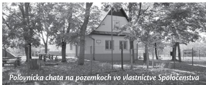
Polovnička chata na pozemkoch vo vlastníctve Spoločenstva