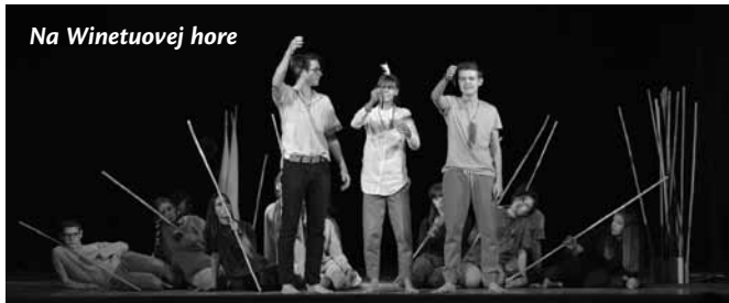
Na Winetuovej hore