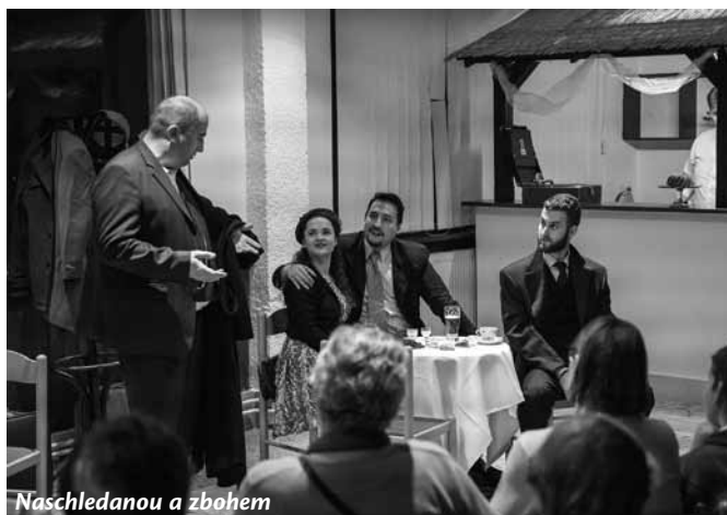
Naschledanou a zbohem