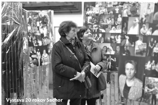
Výstava 20 rokov Šachor

Bonbónikom na torte boli výstavy vo vestibule a v časti sály kultúrneho domu. V tej prvej sme mali možnosť si pozrieť fotografie hercov zo Slovenského národného divadla a tá druhá mapovala dvadsať rokov divadelného spolku Šáchor.