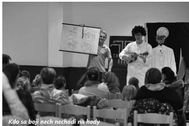
Kdo sa boji nech nechodi na hody

Večer sa predstavilo študentské divadlo Christoffer z Bratislavy s drámou od ruského spisovateľa A.N. Ostrovského „Búrka.“ Keďže táto hra bola písaná v polovici 19. storočia, študenti sa rozhodli, že ju preniesú do dnešnej doby.