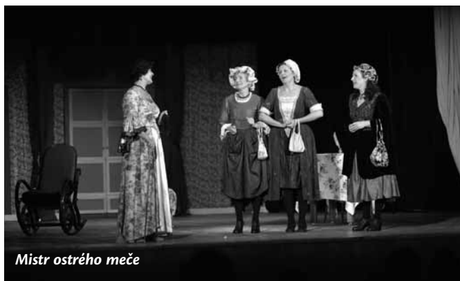
Mistr ostrého meče