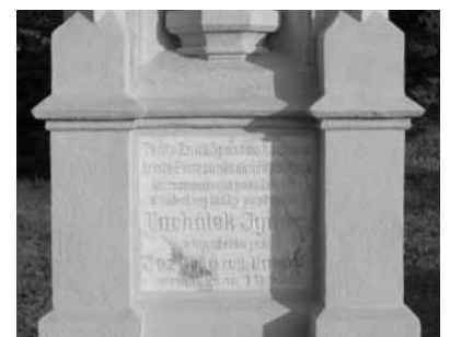
Zábery pôvodného stavu a stavu po obnove križa