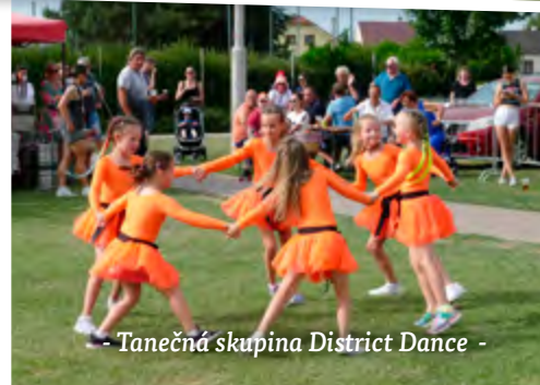
- Tanečná skupina District Dance -