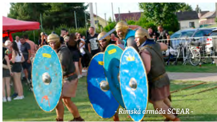
- Rímská armáda SCEAR -