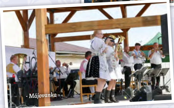
- Májovanka -