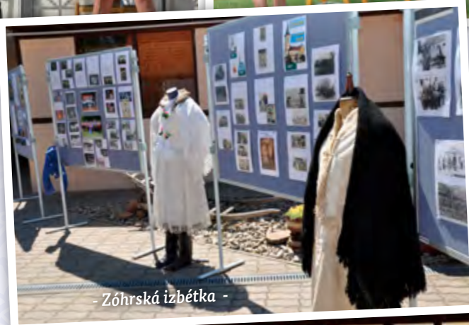
- Zóhrská izbétka -