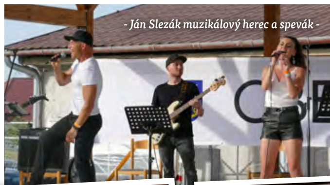
- Ján Slezák muzikálový herec a spevák -