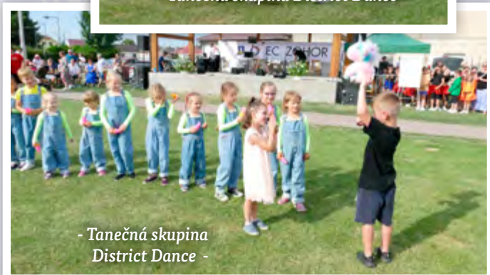
- Tanečná skupina District Dance -