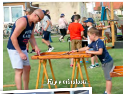
- Hry v minulosti -