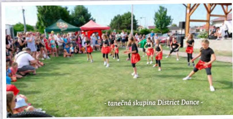
- tanečná skupina District Dance -