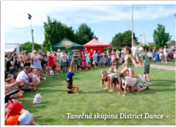
- Tanečná skupina District Dance -