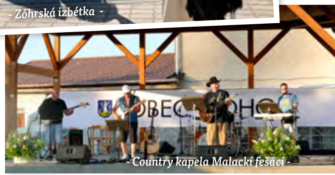
- Country kapela Malackí fešáci -