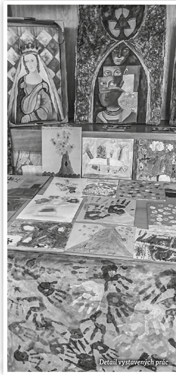
Detail vystavených prác