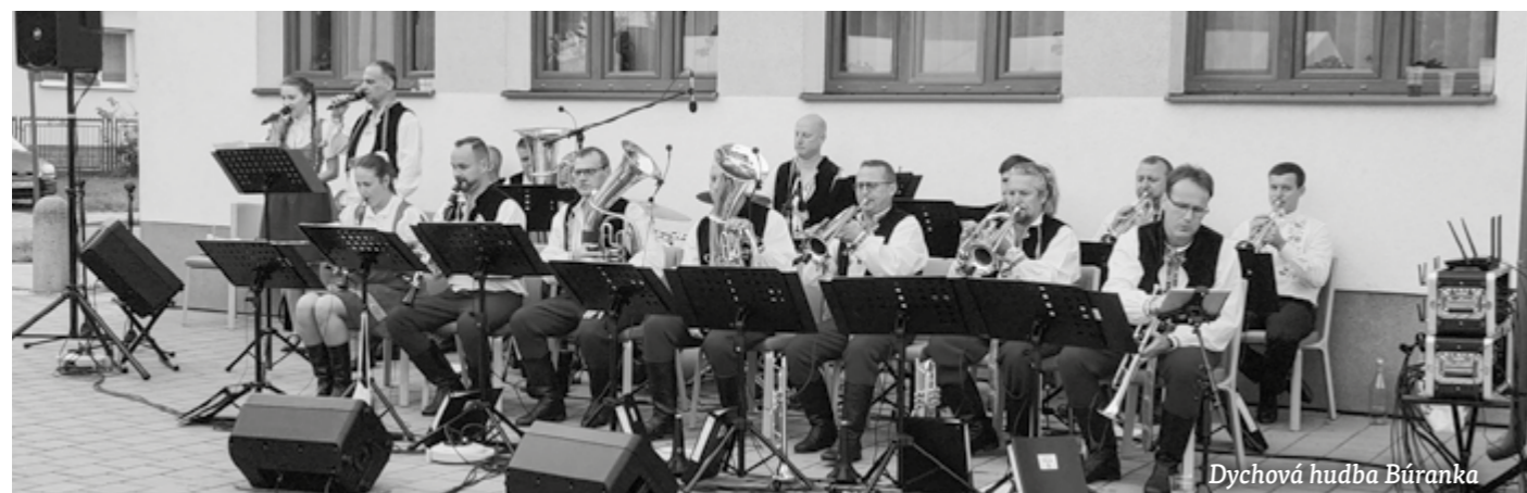
Dychová hudba Búranka