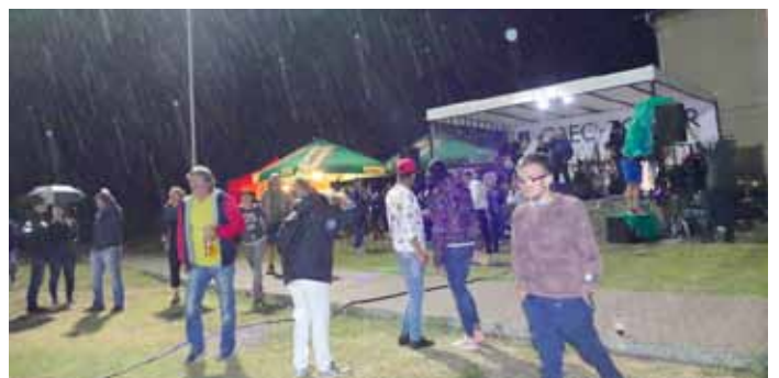
Záver Svätomargitského jarmoku