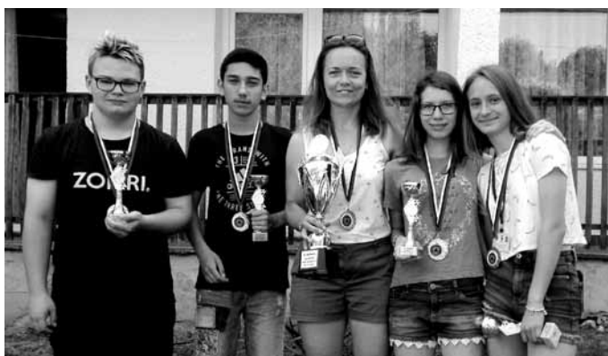
Družstvo A v Snine