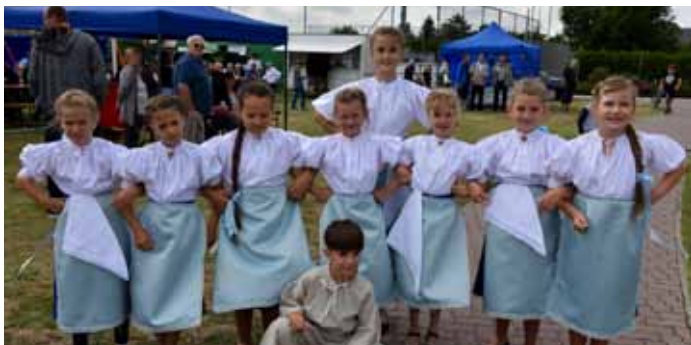
Zóhranek - detský folklórny súbor