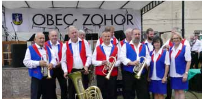
Dychová hudba Zóhranka