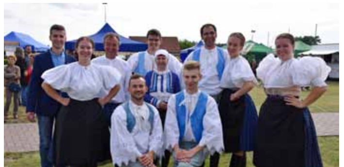
Zóhran - folklórny súbor