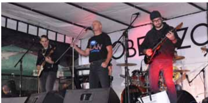
Elán Tribute (Revival)