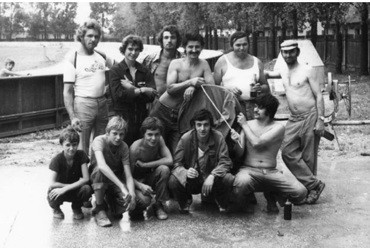
Kolektív brigádnikov AMK Zohor v 70-tych rokoch na budovaní areálu na miestnom štadióne ...