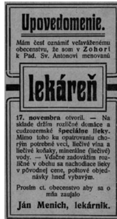
Slovenské ľudové noviny 4.12.1914