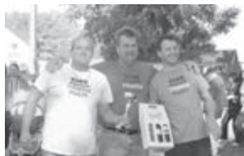
Vítazi vo varení gulášu – Týraní muži