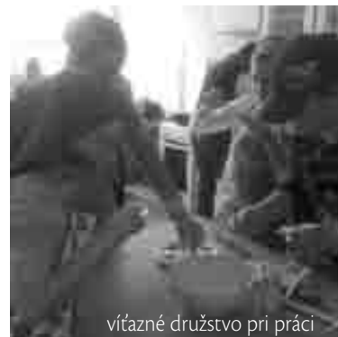
vítané družstvo pri práci

O druhej hodine popoludní sme sa stretli na prvom stupni. Keď nás pani učiteľky vpustili do kuchynky, začali sme si pripravovať základné suroviny. Niektorí mrkvu alebo sardinky, avokádo, cesnak ... Oblečené