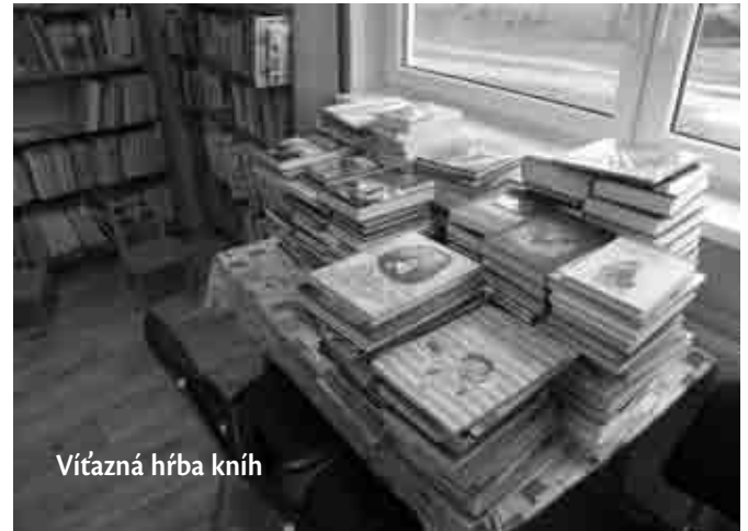
Vitázná hĺba kníh