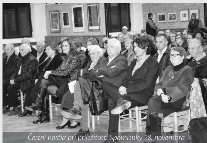
Čestní hostia pri príležitosti Spomienky 28. novembra