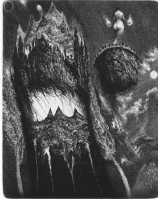
Pour Féliciter 1996