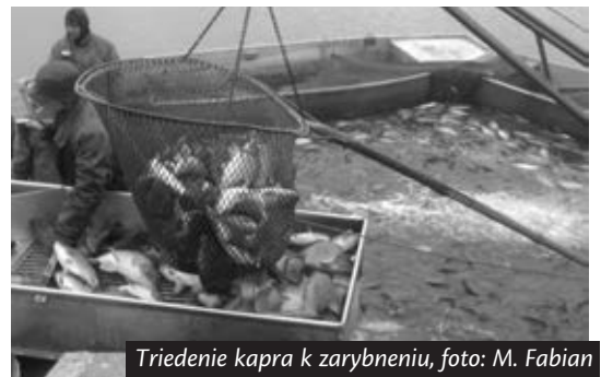
Triedenie kapra k zarybneniu