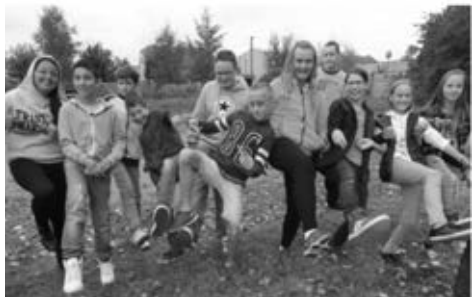
A takto športovala 6.B