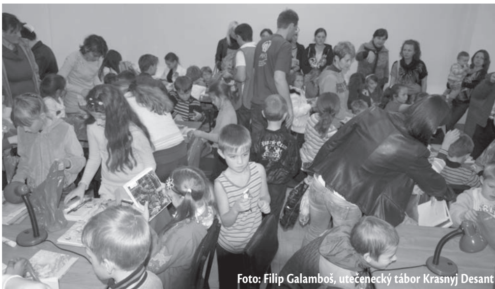
utečenecký tábor Krasnyj Desant