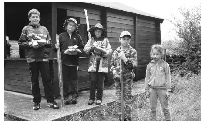
Poobhliadnutie sa za zahájením kaprovej sezóny

Za OO SRZ Zohor sa chcem úctivo poďakovať rodičom a starým rodičom, ktorí svoje ratolesti na pretekoch sprevádzali. Práve ich náklonnosť k záľubám svojich detí je pilierom, na ktorom môžeme my ďalej stavať.