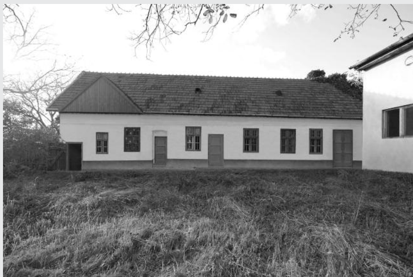
Osvetová beseda – hospodárska časť (vizualizácia rekonštrukcie objektu). Autor: Ing.arch. Peter Buffa