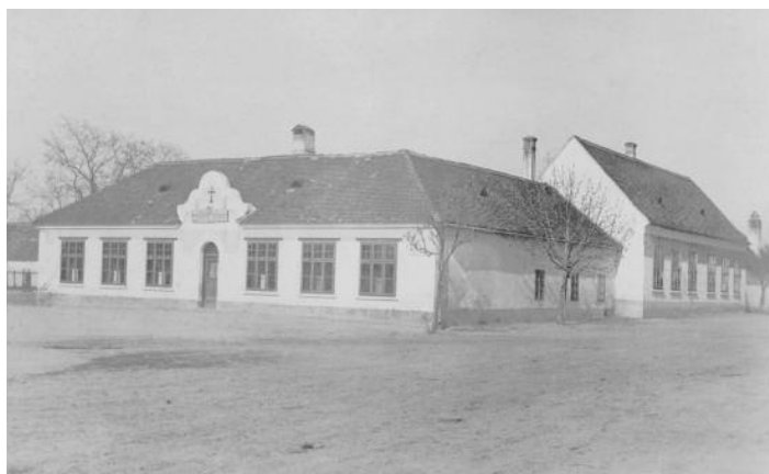
Budova školy r. 1908 - 1934, predná, nižšia časť budovy bola postavená pred rokom 1865