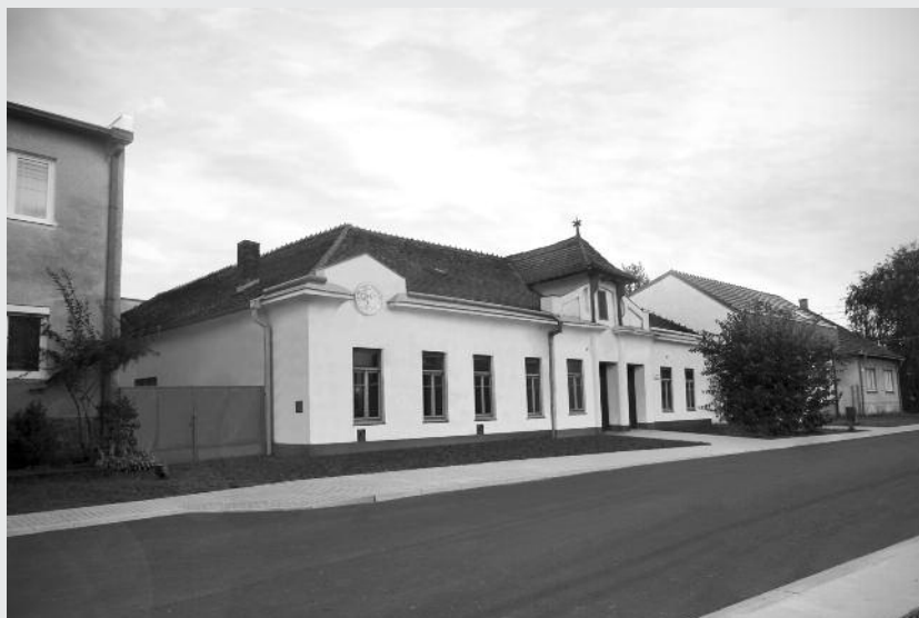
Osvetová beseda – pohľad z ulice (vizualizácia rekonštrukcie objektu).