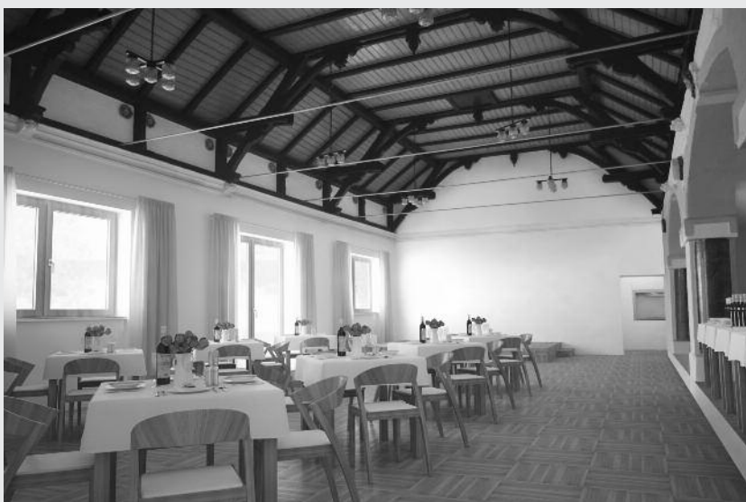
Osvetová beseda – spoločenská sála (vizualizácia rekonštrukcie interiéru). Autori: Ing.arch. Peter Buffa, Ing.arch. Katarína Pavlásková