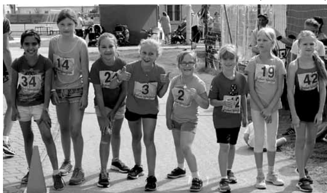
Beh - dievčatá do 10 rokov