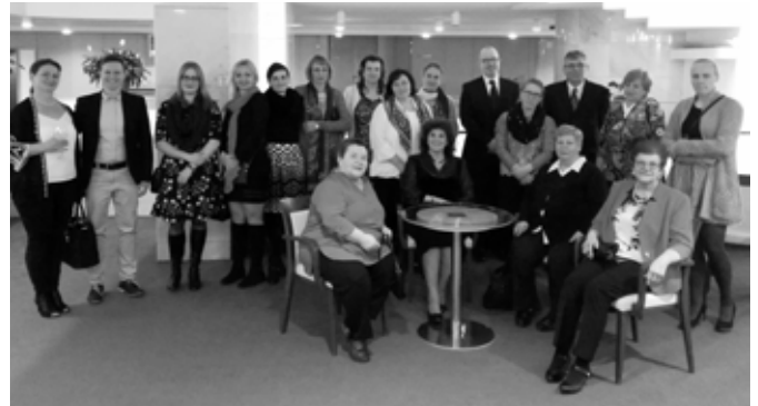
Návšteva SND edukačný program

Nám však nešlo len o zábavu, ale aj vzdelávanie, preto sme do divadla prišli skôr, aby sme sa porozprávali s lektorkou dramaturgie, prezreli si zákulisie, prípravu scény a v neposlednom rade sa dozvedeli viac o hre, okolnostiach jej vzniku, súvislostiach s dnešnou dobou, motívami režiséra a mnohom ďalšom. Spolu sme v divadle strávili vyše päť hodín, no čas rýchlo ubehol a nám sa tak skončila prvá časť výchovno-vzdelávacieho projektu, o ktorom sa viac dozviete v závere článku.