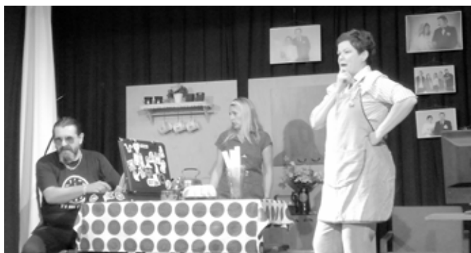
Hra PEŠKOVCI Divadla na kolene, Častá