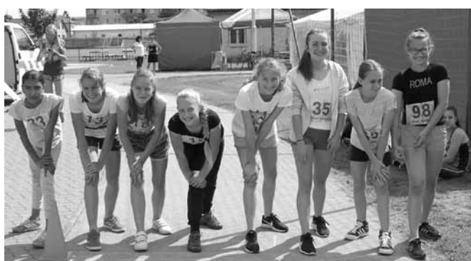
Beh - dievčatá do 13 rokov