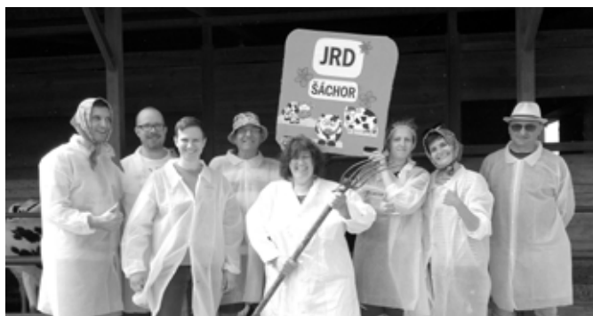
JRD Lozorno exkurzia v kravíne