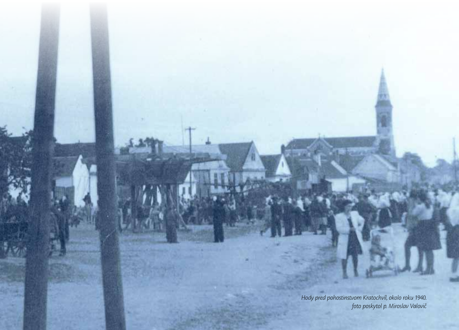
Hody pred pohostinstvom Kratochvíl, okolo roku 1940.