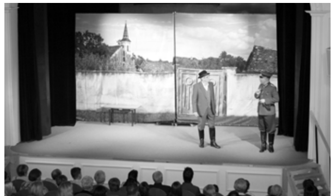
Účinkovanie v BOLERADICIACH apríl 2018

V posledných novinách sme spomínali postupovú súťaž Divadelné konfrontácie v Pezinku. Danú súťaž sme nemohli absolvovať z organizačných dôvodov. Nevadí, veríme, že budúci rok sa nám podarí zúčastniť.