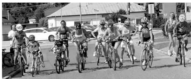
Cyklistika - ženy

1. miesto - Slobodovci, 2. miesto Dudekovci a 3. miesto Križanovci