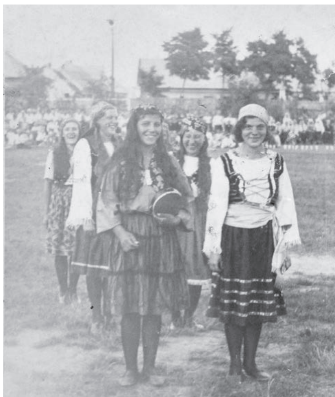
Verejné orolské cvičenie v roku 1934 na starom ihrisku, kde sú dnes postavené budovy ZŠ