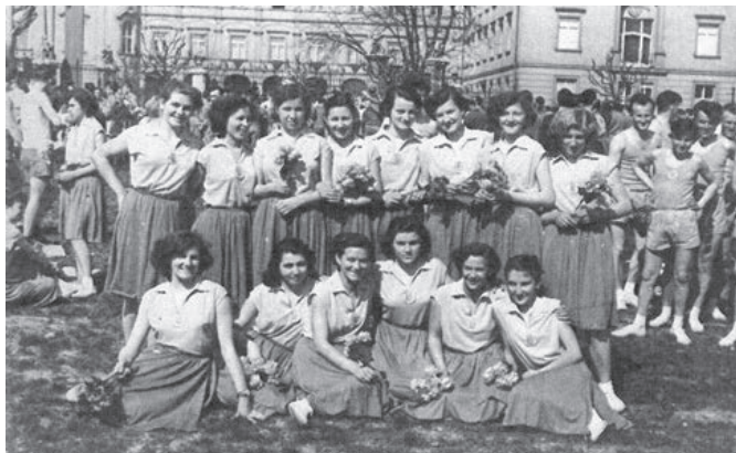
Účastníčky I. CS v Prahe na Krajskej spartakiáde v Bratislave v roku 1955

cvičenie – na celoštátne podujatie do Prahy. Ako sme už spomenuli, predchádzali tomu spartakiádne cvičenia na nižších úrovniach. Jedno také podujatie sa konalo aj v Zohore.