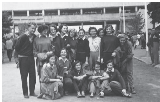
Cvičienky Zohora pred „Bránou borcov“ na Strahove v Prahe