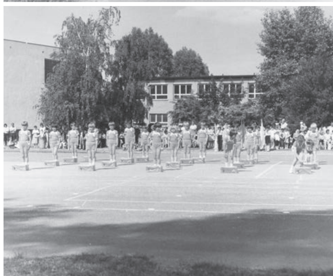
Čs. spartakiáda 1985