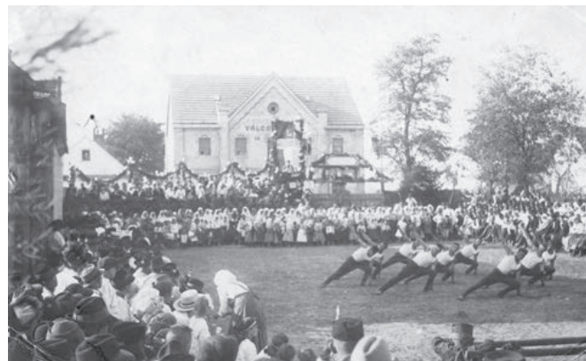
Verejné cvičenie Sokola na dnešnej Lozornianskej ulici v roku 1922