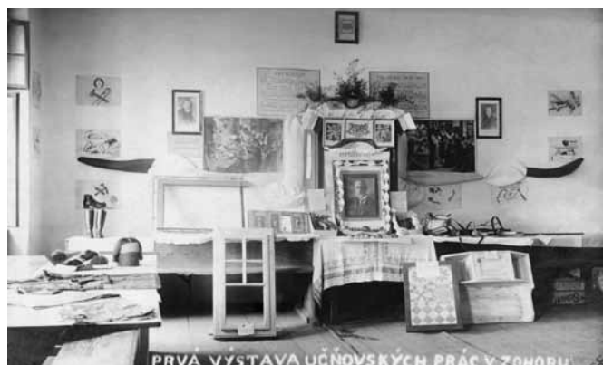
Prvá výstava učňovských prác v Zohore

Učni boli prijímaní na základe samostatnej, písomne uzatvorenej, zmluvy najneskôr do štyroch týždňov od začatia učebného pomeru. Učebná zmluva bola oslobodená od kolkov a poplatkov a obsahovala: meno zamestnávateľa, názov živnosti a miesto prevádzky. Údaje o učňovi boli: meno, priezvisko, vek a bydlisko. V prípade neploletého učňa bolo treba uviesť meno a priezvisko jeho rodičov, ich zamestnanie a bydlisko. Zmluva mala obsahovať aj dátum vyhotovenia a predpokladanú dĺžku trvania učebného pomeru. Majiteľ živnosti sa v zmluve zaväzoval, že zabezpečí sám alebo pomocou spôsobilého zástupcu vyučovanie odborných zručností výučného odboru. V zmluve sa dohodli aj prijímacie podmienky, prípadná mzda učňa, stravovanie, ošatenie, ubytovanie, doba trvania učenia, výška skúšobnej taxy pri skúške, poplatok spoločenstvu za prípoved' (zahlasenie) a za vyučenie (vyučenie). Nedodržanie týchto predpi-