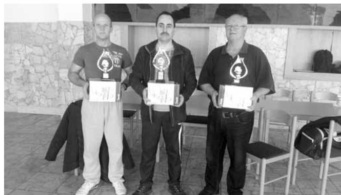
Ophár starostu obce 2016 - Stolný tenis