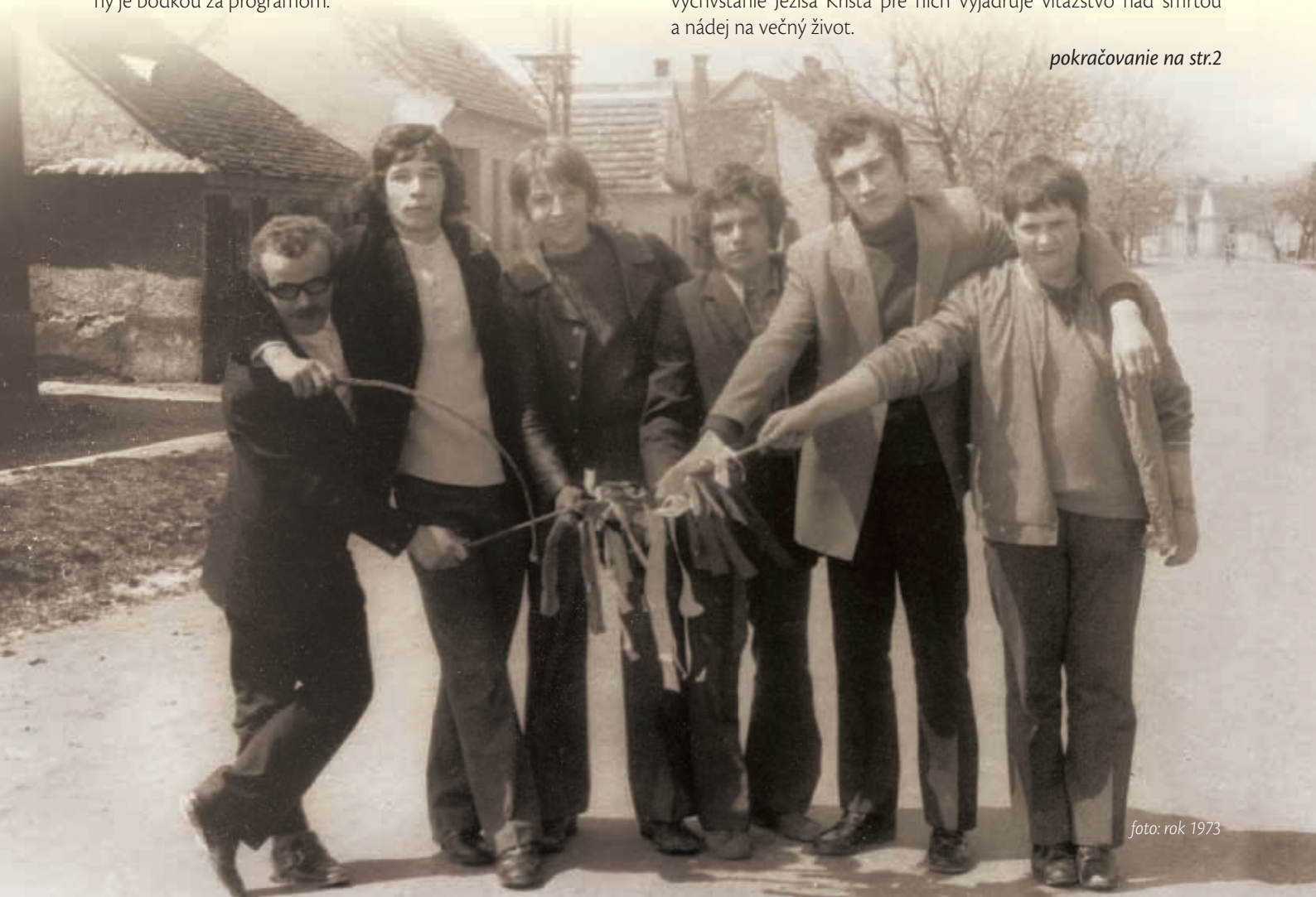
foto: rok 1973