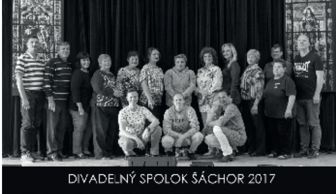
DIVADELNÝ SPOLOK ŠÁCHOR 2017

S našou divadelnou hrou „Breviár ...“ sme sa prihlásili na krajskú súťažnú prehliadku s názvom „Divadelné konfrontácie“, z ktorej budú