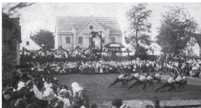
Cvičenie Orlov pred Valcovým mlynom v Zohore 18.septembra 1922