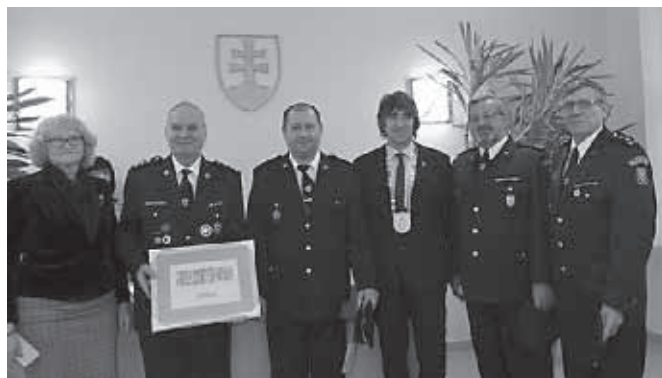
Pán starosta a predstavitelia DHZ v Zohore

Starosta obce Zohor ďalej udelil Cenu starostu obce za rok 2017 Dobrovoľnému hasičskému zboru 1 za výnimočné činy na úseku ochrany pred požiarmi a pomoc pri odstraňovaní škôd po veterných smrštách. Dobrovoľný hasičský zbor v Zohore má v našej obci viac ako storočnú tradíciu. Vznikol v roku 1879 a po celú dobu svojej existencie spája nadšených ľudí, ktorí sú ochotní pomáhať iným. Hasenie požiarov, odvracanie nebezpečenstva živelných pohrôm, likvidácia ich následkov, preventívna činnosť, organizovanie kultúrnych a spoločenských akcií, pomoc pri organizovaní obecných akcií, výchova mladej hasičskej generácie – to všetko sú aktivity dobrovoľného hasičského zboru. Hasiči mnohokrát neváhajú obetovať kus svojho života pre šťastie a spokojnosť našich spoluobčanov. Úprimná vďaka patrí najmä za priame zásahy, keď často s vypätím všetkých síl a s nasadením vlastného života zachraňujú životy ľudí a miliónové hodnoty. V súčasnej dobe má Dobrovoľný hasičský zbor v Zohore okolo 70 členov a patrí medzi najaktívnejšie organizácie v našej obci. Hasiči zohrali hlavnú úlohu pri realizácii protipovodňových opatrení, odstraňovaní následkov ničivých búrok a smrští, ktoré sú v poslednom období čoraz častejšie. Aj v roku 2017 ich zasiahlo našu obec niekoľko.