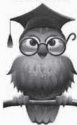
Učiteľ na začiatku školského roka