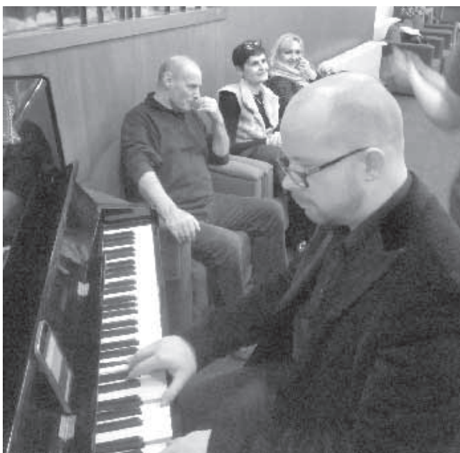
Silvester v Hodoníne 2017