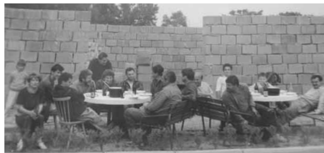
Brigádnici pri obede 1991