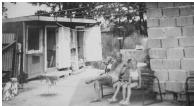
Po výsadbe stromčeka