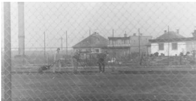
Výstavba ihrísk 1987