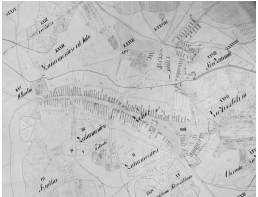
Dolná ulica na katastrálnej mape z roku 1854