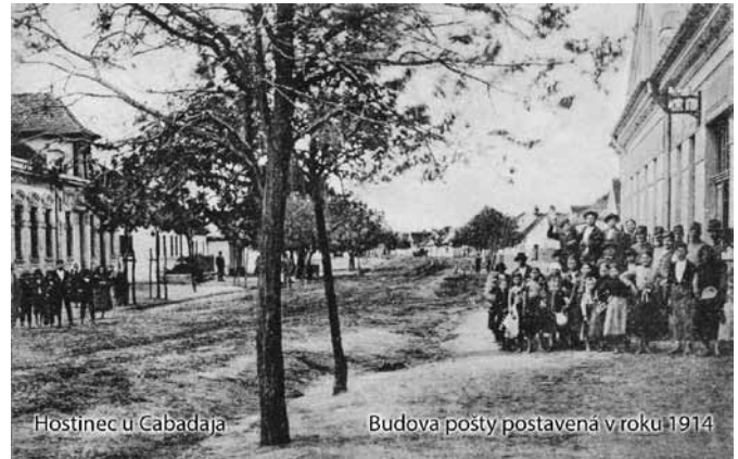
Hostinec u Cabadaja a budova pošty