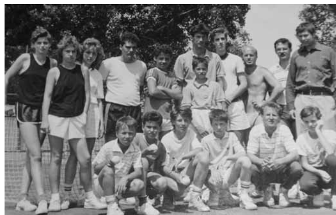
Po ligovom stretnutí 1990