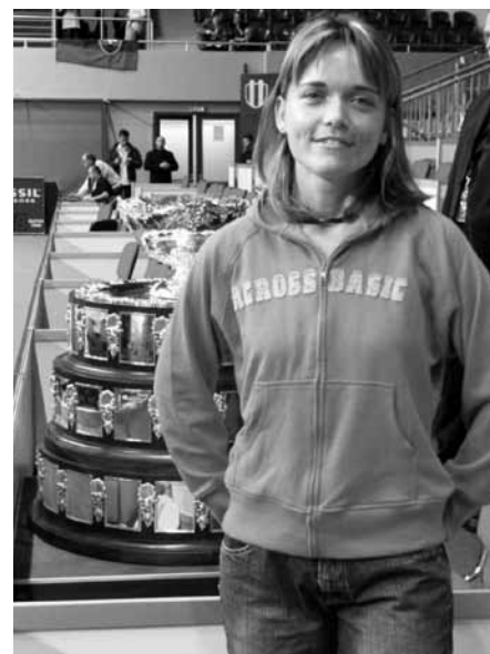
Finále Davis Cupu Slovensko – Chorvátsko, 2005