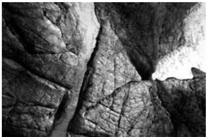
Útek zo zlatej krajiny

Bez rodiny sa nedá robiť absolútne nič. Pokiaľ chce človek sprostredkovať čisté myšlienky, tie musia byť v prvom rade stredobodom jeho